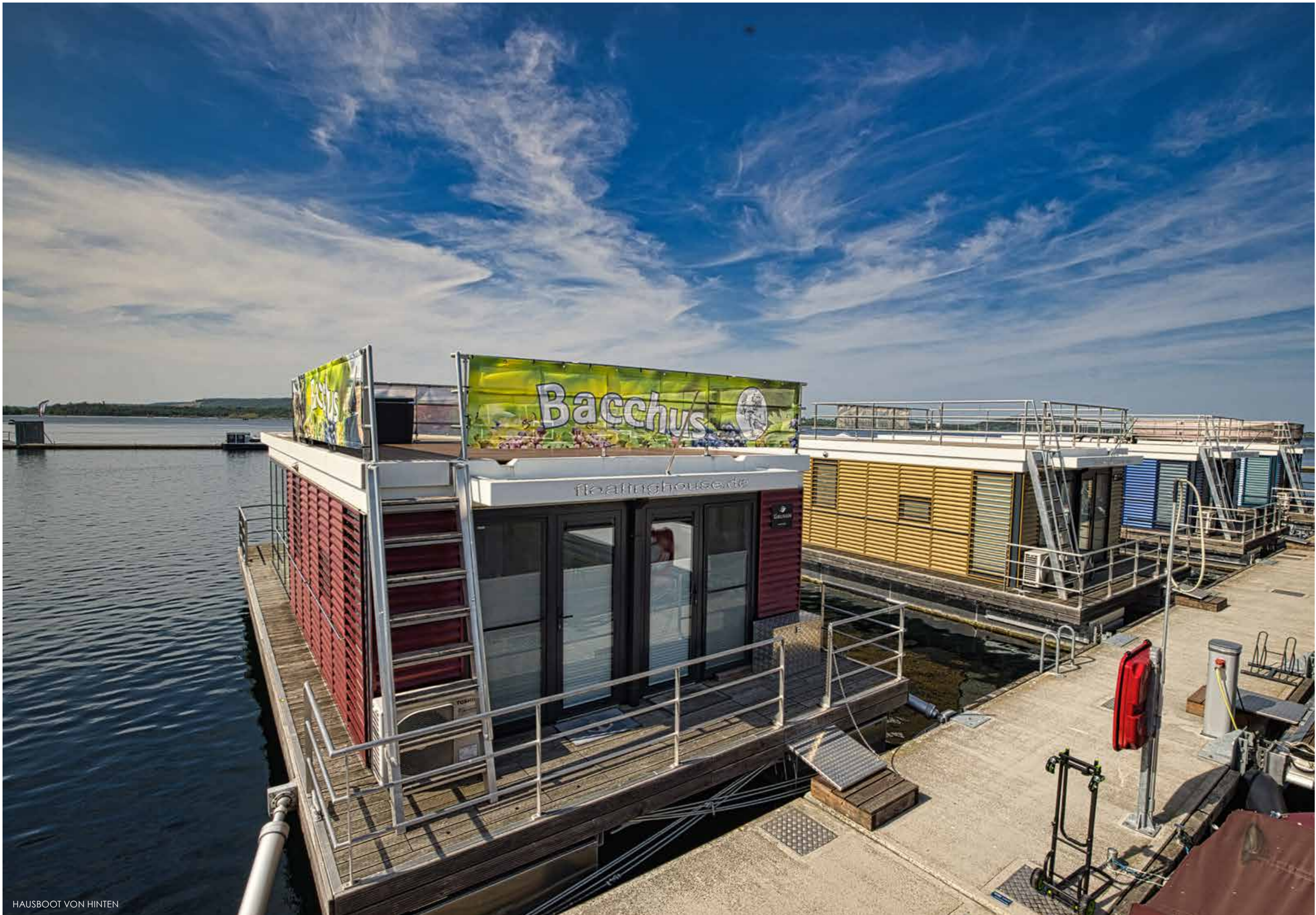
HAUSBOOT VON HINTEN